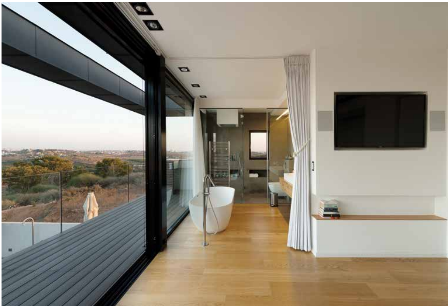
מבט מבפנים אל הקופסה החיצונית שנבנתה סביב הבית.