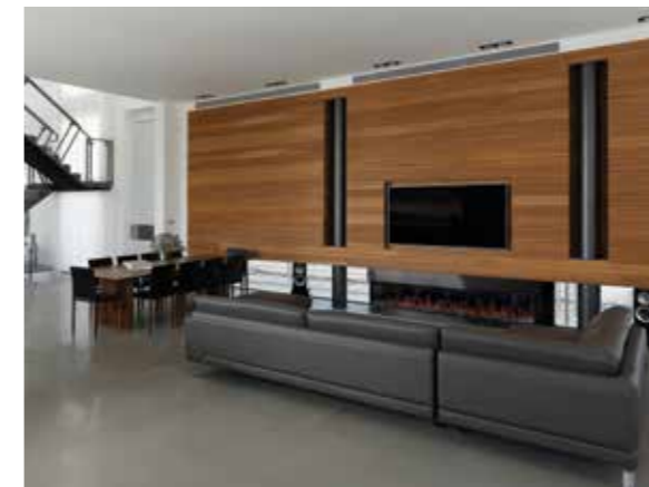
הקמין מופעל: "אורטל".

המדרגות נמצאות במרכז הבית, והן מהוות אלמנט פיסולי עם נוכחות דומיננטית מאוד. מעבר לשימושיות המובנת שנועדה למדרגות, הן הגורם המפריד בין הסלון, פינת האוכל והמטבח לבין פינת הטלוויזיה האינטימית