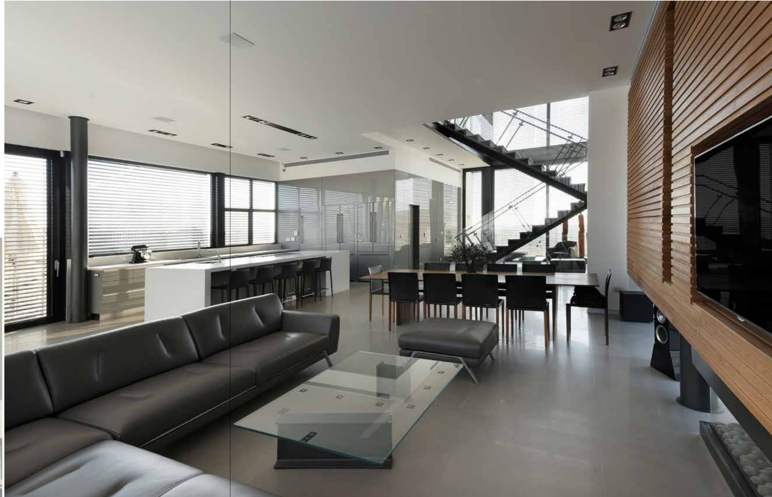
קמין הגז שולב בקוביית העץ (מטבח: "סמל", משטחים: "ארקדה", מקרר: "סימנס", פינת אוכל: "טולמנס", עבודות זכוכית: "שקוף", סלון: "פיטרו הכט").